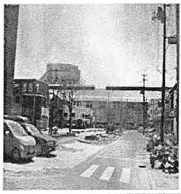
2011.5 災害廃棄物撤去後