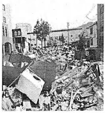
2011.4 津波被害の直後 (岩手県釜石市大町付近)